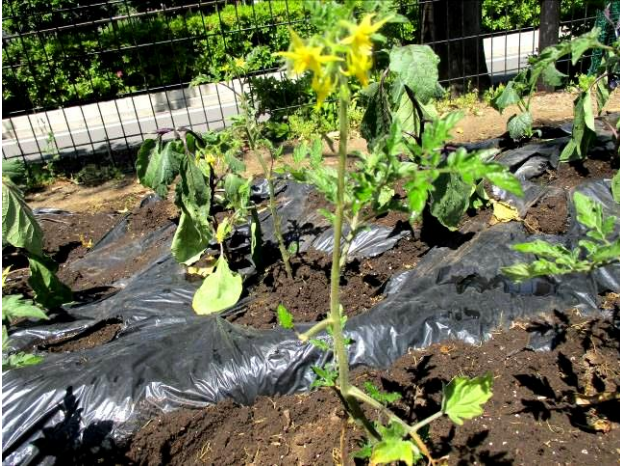
これは、トマトです。

てつぼうのちかくにあるかだんにうえてあります。学校のそばをとおりかかったときにでも、見てみてくださいね。